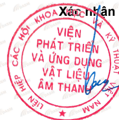
Vũ Việt Dũng