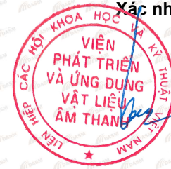
Vũ Việt Dũng